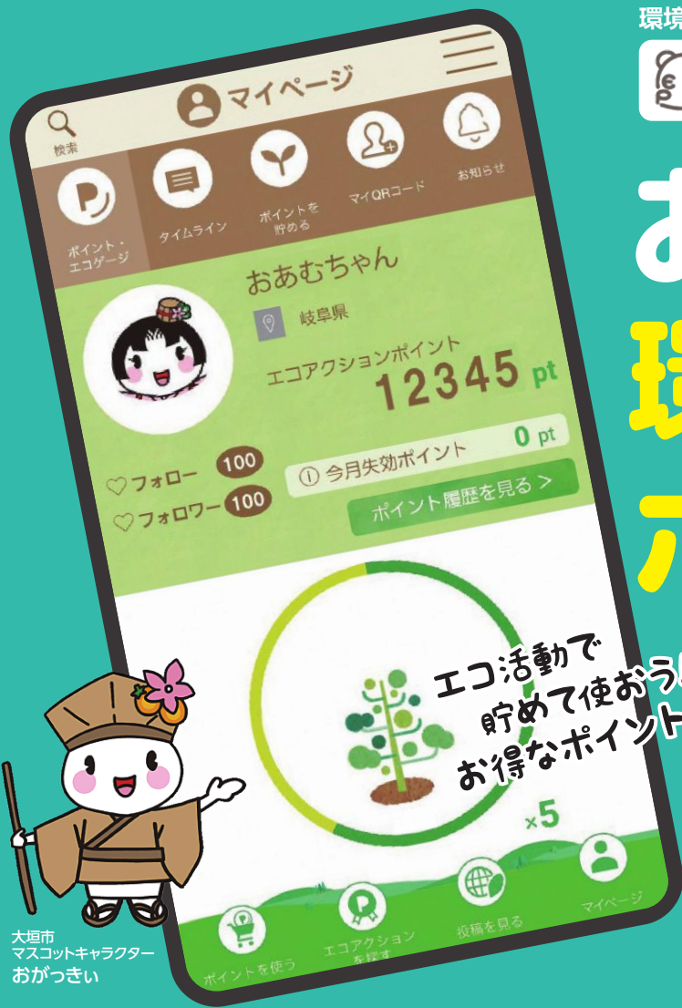
大垣市 マスコットキャラクター おおがきい