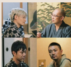
見えない価値の行方 #1 文化の入り口と壁