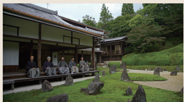
これからのビジネスに必要な美意識について語る