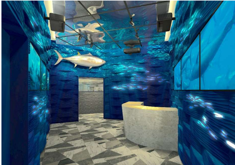
「近大卒の魚と紀州の恵み 近畿大学水産研究所 大阪・関西万博 ウォータープラザ店」店舗イメージ