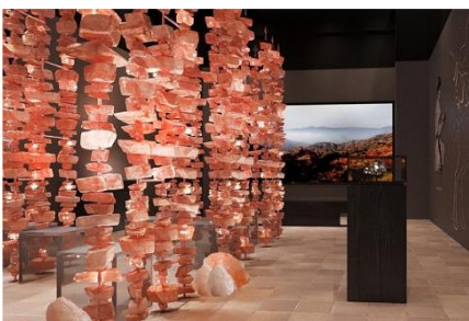
パキスタンパビリオン「ピンクソルト」