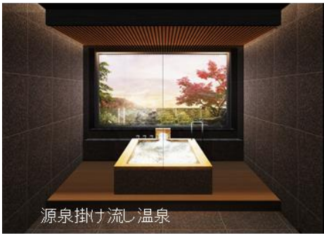
源泉掛け流し温泉