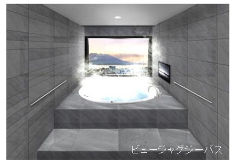
ビュージャグジーバス