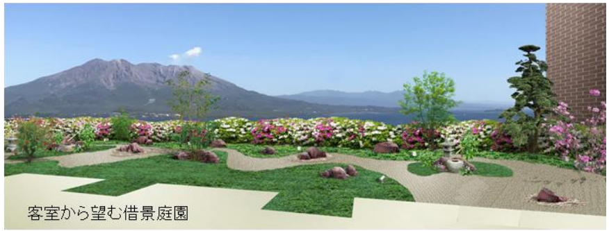
客室から望む借景庭園