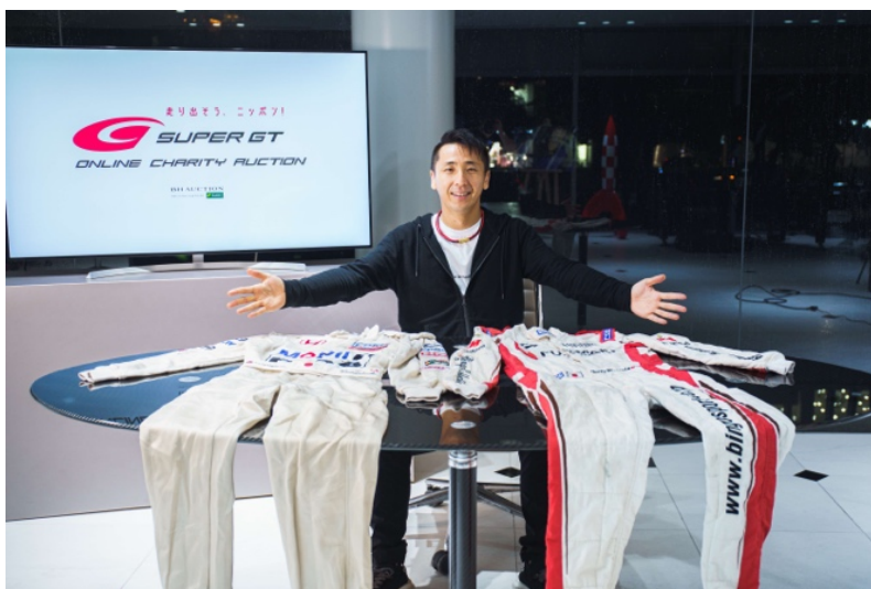
（レーシングスーツ2着を出品する松田次生選手）

「MOTUL AUTECH GT-R」（NISMO）でGT500クラスに参戦する松田次生選手。2014年と2015年の2年連続でシリーズチャンピオン（GT500クラス）に輝いたシリーズを代表するトップドライバーからは、SUPER GTの前身である全日本GT選手権時代に「NAKAJIMA RACING」（中島企画）より参戦した際の貴重なレーシングスーツと、イベントなどで走行する際に着用する最新のレーシングスーツの2着を出品。