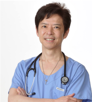
ナグモクリニック総院長 南雲吉則