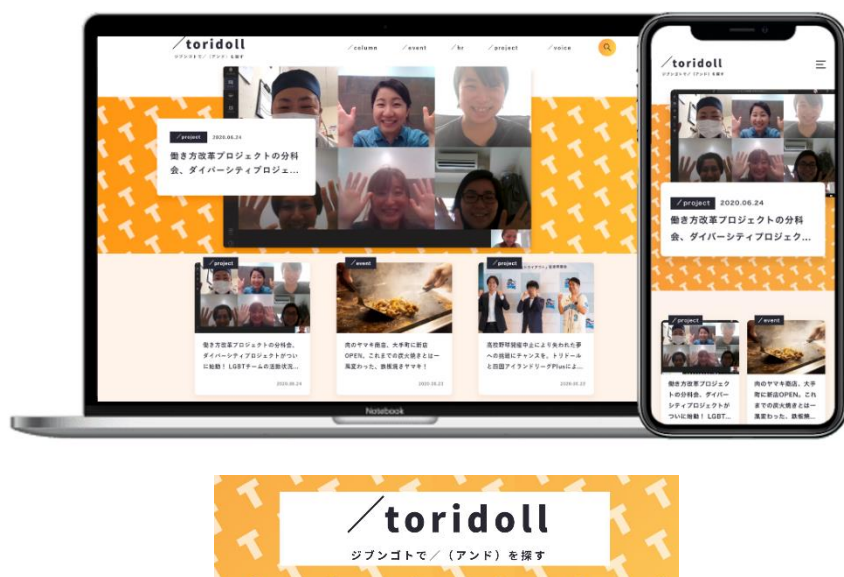
(上) オウンドメディア「/toridoll」の画面イメージ (下) 「/toridoll」ロゴ