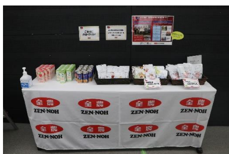
メディア控室の全農ブースの様子

全農は今大会の報道やテレビ中継のために来場したメディアの皆さんの控室にも「全農ブース」を設置し、全農の商品ブランド「ニッポンエール」のご当地グミ・ドライフルーツや、福岡県産の飲料を提供し、メディアの皆さんも「ニッポンの食」で応援しました。