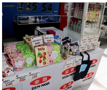
福岡県産の農産物・加工品