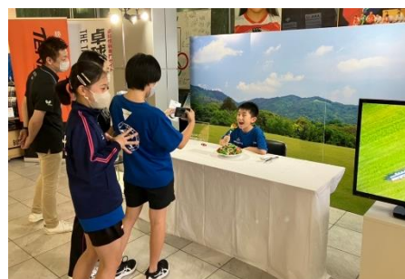
フォトスポットで写真を撮る来場者