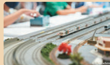
JRトレインフェスタ