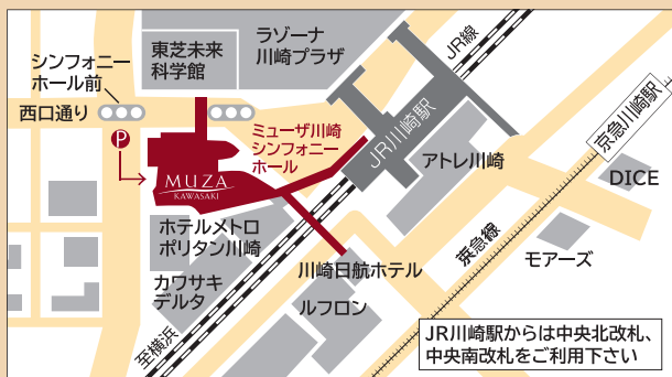
[交通] JR川崎駅中央西口直結

[注意事項] *公演詳細・館内設備・サービス等についての最新情報は、ミュージア川崎シンフォニーホール公式サイトでご確認ください。*出演者・曲目等の公演内容につきましては変更が生じる場合がございますのでご了承ください。 *公演中止の場合を除き、ご予約・ご購入いただきましたチケットのキャンセル・変更はお受けできません。*営利を目的としたチケットの転売は固くお断りいたします。*演奏中の入退場はできません。*公演中の写真撮影、録音等は固くお断りいたします。*館内での喫エチケットや適切な手指消毒、プラボー等の声援をされる際のマスク着用を推奨いたします。*4歳未満のお子様のご入場はできません。託児サービスをご利用ください。