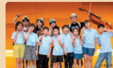
川崎市内小学生で構成される「ジュニア・プロデューサー」企画公演