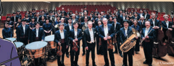
川崎市フランチャイズオーケストラ [管弦楽] 東京交響楽団 Tokyo Symphony Orchestra

ミュゼのブログでも活動を紹介します！応募したきっかけや進捗などを二人が執筆しています。