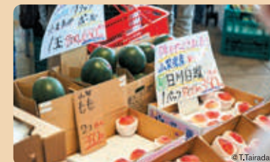
かわさきいいまちマルシェ