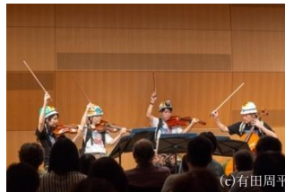
(上)お客様のチケットをもぎる ジュニア・プロデューサー (左)ジュニア・プロデューサーの 演出で冒険者に扮して演奏する 東京交響楽団のメンバー