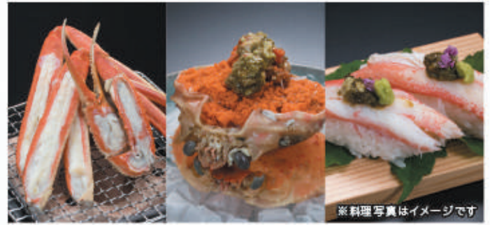
※料理写真はイメージです

重さ1kg以上、甲羅幅13cm以上の厳しい基準を満たした「特選」を頂点に、より多くの方に味わっていただくため、「庄内北前ガニ」に通常ブランドが加わりました。