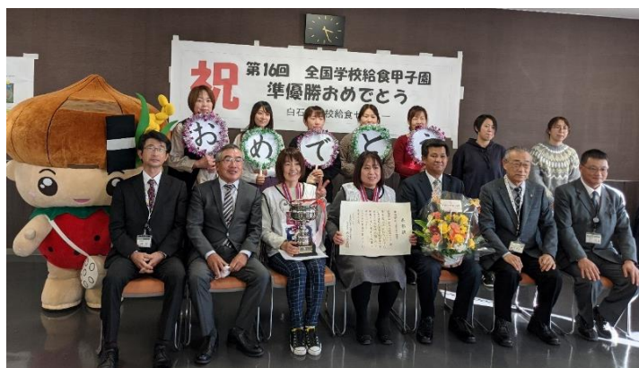
【サテライト会場】 白石町学校給食センターの皆様