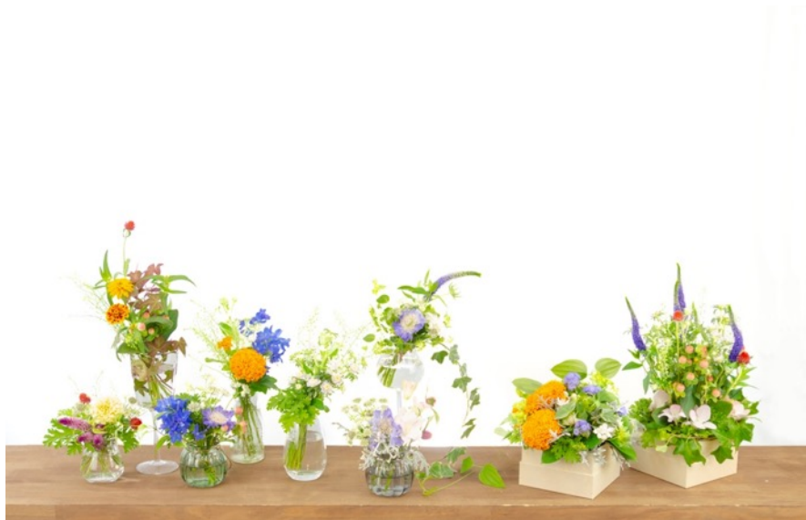
(ご家庭にプロデザイナーがアレンジしたお花を毎週お届けする「花便りプラン」もご用意)

また、法人向けにもオフィスや店舗などを華やかに演出するお花を、定期的にお届けする新しいサービス「彩時間 for business」( https://irojikan.jp/lpc/business )も開始しました。