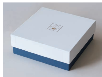
「麻のファブリックパネル」 専用化粧箱

「麻のファブリックパネル」が3枚まで入る 専用の化粧箱を別途有料にて承ります。 名入れパネルのご注文をいただいたお客様に 限り、名入れパネルを含む2枚以上を同時に ご購入の場合、無料でお付けいたします。