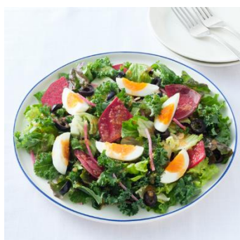
選んで作るサラダ (カスタマイズサラダ一例)