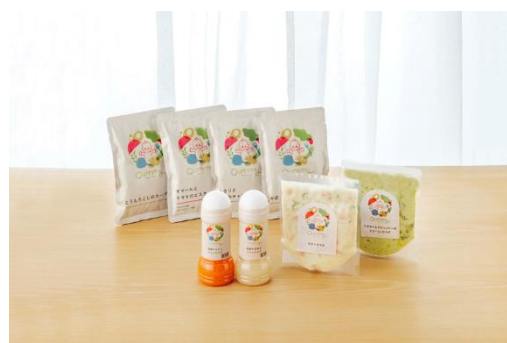
『Qummy®』オリジナル商品 (奥：スープ、手前中央：ドレッシング、右：惣菜サラダ)