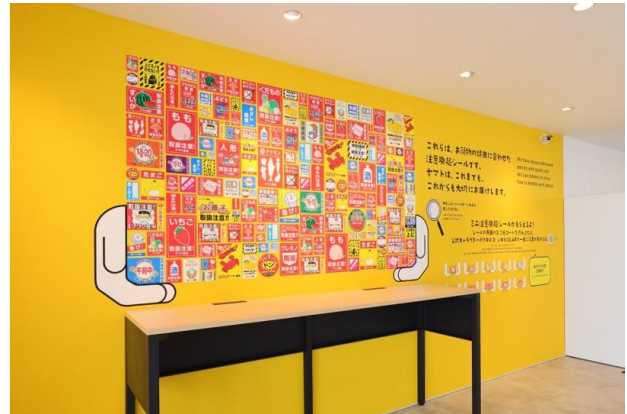
<注意喚起シール展示>