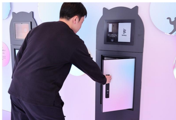
<顔認証機能を活用した未来の受け取り体験>