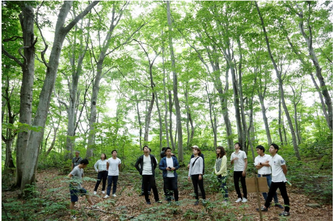
「ブナ林で学ぶ環境」