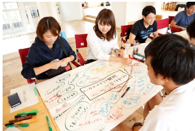
「ディスカッション風景」

企業が、地域社会と共に人材育成に取り組む体験を通したプロジェクト型の研修や、講演、セミナー、研修と企業にあったカリキュラムをオフライン、オンラインいずれの形式でも実施しています。特に、eラーニング動画のサービスは、幅広く SDGs の理解浸透を目指している企業にお勧めです。