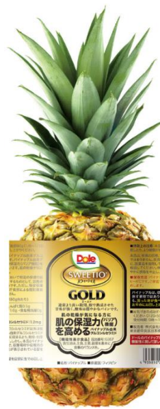
「スウィーティオパイナップル ゴールド」 届出番号：G357