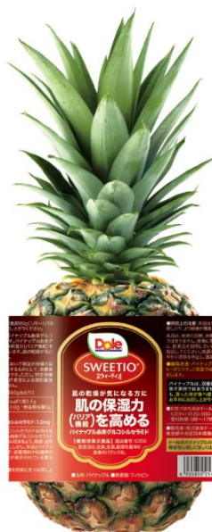
「スウィーティオパイナップル」 届出番号：G356

これを記念して、「スウィーティオパイナップル」1箱を100名様にプレゼントする「機能性表示食品発売記念キャンペーン」を1月21日(金)12時から実施します。