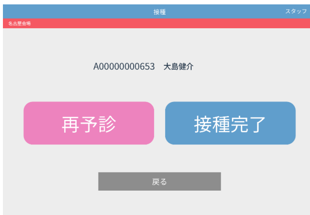
◇接種登録画面イメージ