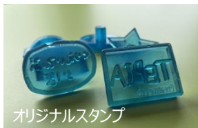
オリジナルスタンプ

かんたん3Dモデリング講座 所要時間：約65分 3月29日（火） 10:30 オリジナルスタンプを作ろう！