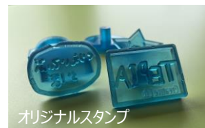
オリジナルスタンプ

2022年 5月 1日（日） 15:00 オリジナルスタンプを作ろう！ 5月 3日（祝火） 15:00 オリジナルスタンプを作ろう！