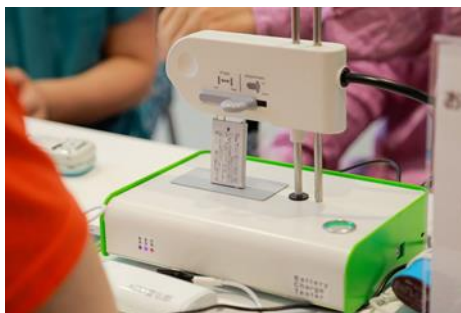
<再起動専用機器「バッテリーテスター」>

本イベントでは、会場に「バッテリーテスター」を設置し、お客さまの「おもいでケータイ再起動」をサポートします。充電不可となったケータイを充電・再起動することで、お客さまが見ることを諦めていた懐かしい写真を再びプリントして専用フォトフレームに入れてお渡します。