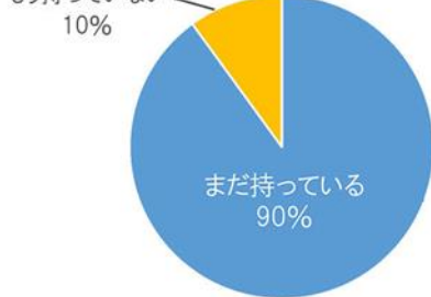
Q. むかし使っていた携帯電話をお持ちですか？