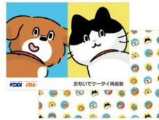
<オリジナルフォトフレーム>