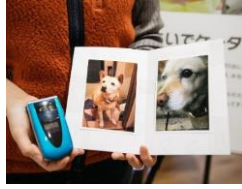
<復活した写真をプリントアウト>