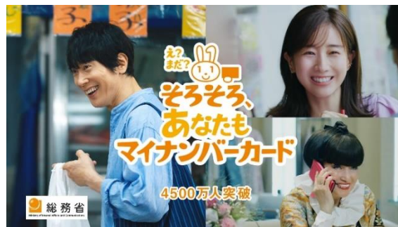
「マイナンバーカード普及促進」TV-CM 「3人に1人持ってる」篇(写真左)、「メリットを知る」篇(写真右) ※黒柳さん出演のCMは今後展開予定です