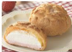
「パイシュー(栃木県産とちあいか苺のクリーム&ヨーグルト風味ホイップ)」