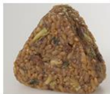
「黒チャーハンおにぎり」