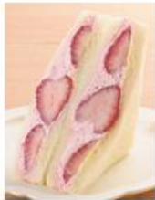
「苺&ダブルクリームサンド」

今回発売する商品は、3 月 11 日発売の「 苺&ダブルクリームサンド 」(税込 451 円)、「 パイシュー(栃木県産とちあいか苺のクリーム&ヨーグルト風味ホイップ) 」(税込 192 円)、「 もちもちとしたリングドーナツ(栃木県産とちあいか苺のジャム入りホイップ) 」(税込 181 円)、「 牛乳パン(栃木県産とちあいか苺) 」(税込 149 円)、「 いちごのパウムクーヘン(栃木県産とちあいか苺のピューレ入りクリーム使用) 」(税込 173 円)、「 黒チャーハンおにぎり 」(税込 203 円)の 6 品と、3 月 18 日発売の「 いちごのロールケーキ(栃木県産とちあいか) 」(税込 297 円)、「 宇都宮焼そば 」(税込 497 円)の 2 品の計 8 品です。