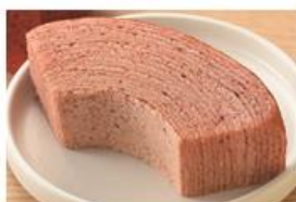
「いちごのパウムクーヘン(栃木県産とちあいか苺のピューレ入りクリーム使用)」