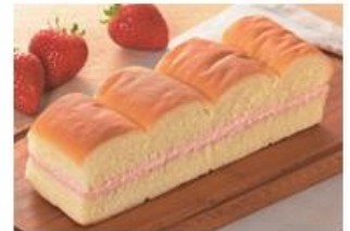
「牛乳パン(栃木県産とちあいか苺)」