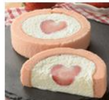
「いちごのロールケーキ(栃木県産とちあいか)」