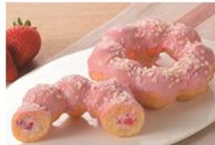
「もちもちとしたリングドーナツ(栃木県産とちあいか苺のジャム入りホイップ)」