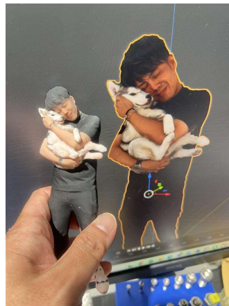
<リアルな仕上がり>

リアルなオリジナルのフィギュアは、ウェディングフォトと並ぶ記念品や、コンペティションのトロフィーに代わる副賞として…といった用途のほか、ペットとの思い出づくりなど、様々な利用が想定されます。