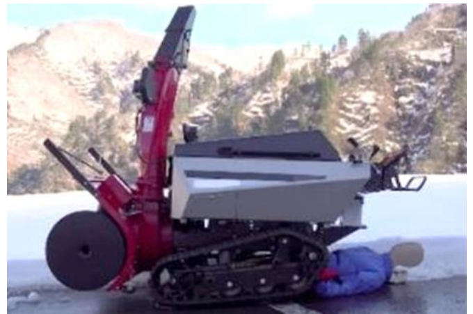
除雪機の下敷きになった様子（イメージ）

使用者がデッドマンクラッチ機構を大きな洗濯バサミで固定して安全機能を無効化したため、除雪機を後進中に転倒した際に、手を離しても除雪機の走行が停止せず、使用者に乗り上げて下敷きとなったものと考えられる。