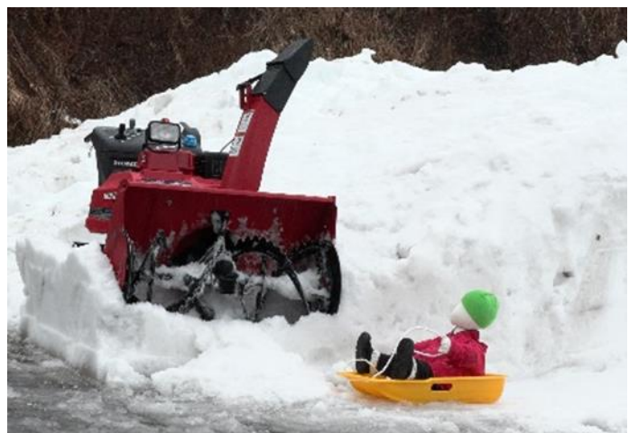
除雪機の近くでこどもが遊んでいる様子（イメージ）

除雪作業の途中、使用者が除雪機のエンジンを切らずにオーガが回転したままその場を離れたため、周囲で遊んでいたこどもがオーガに接触したものと考えられる。