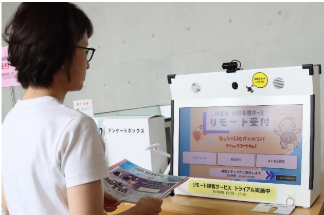
<施設利用者側 (1F 受付) >

※1)スタッフが離れた場所からモニター越しに現場の様子をリアルタイムで確認し、接客を行うことができるサービス