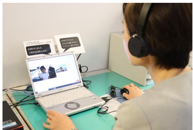
<スタッフ側 (2F 事務所) >