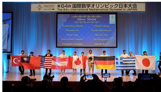
<2023年に開催された第64回国際数学オリンピック日本大会の様子>

生命保険では、確率・統計的手法を用いた商品開発を行うにあたって、数理業務の専門家である「アクチュアリー」がその中心的な役割を担っており、当社においても31名*のアクチュアリー正会員が幅広い分野で活躍しています。