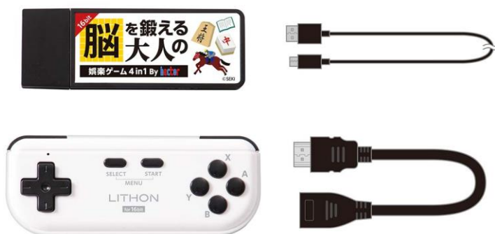
製品画像 (セット内容)