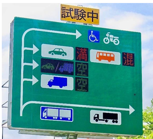
駐車マス案内標識

なお、トイレ、駐車場のバリアフリー化については、商業施設リニューアル前に一部先行オープンしております。