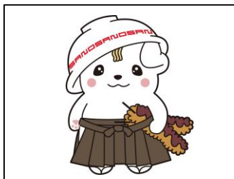
佐野ブランドキャラクターさのまる©佐野市