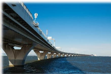
▲ 木更津側からの東京湾アクアライン