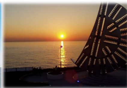
▲ カッターフェイス越しに沈む夕日