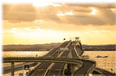
▲ 海ほたるPAから木更津側を望む朝焼け

フォトコンテストの応募要領等の詳細は、海ほたる公式ホームページの「イベント&ニュース」( https://www.umihotaru.com/news/2022/07/detail_1045.html )からご確認ください。