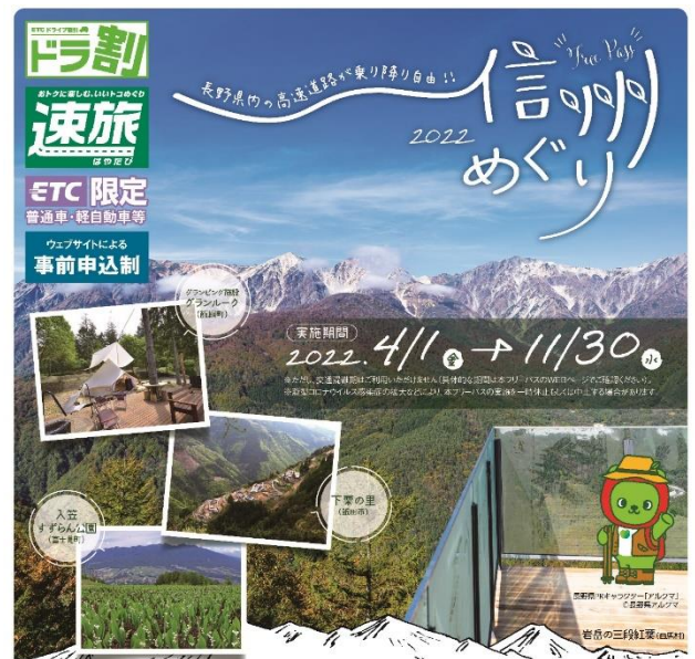
信州でカラダもココロも深呼吸

「北関東周遊フリーパス」及び「信州めぐりフリーパス2022」の各商品の詳細については下記のとおりとなります。