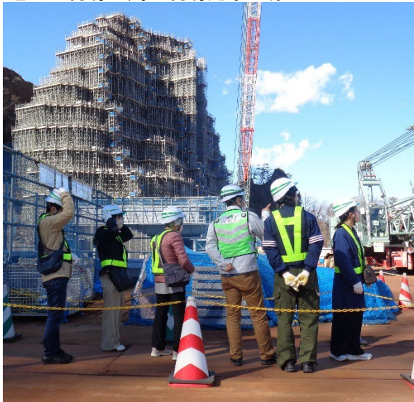
過去の現場公開や現場見学の様子

上信越自動車道 松井田妙義(まついだみょうぎ)インターチェンジ(以下「IC」)～碓氷軽井沢(うすいかるいざわ)ICの北野牧トンネル上部(群馬県松井田町大字北野牧)に位置する当初高さ70mにおよぶ岩塊を撤去する工事です。現場公開では、工事用モルレルへの乗車や巨大なクレーンなどの重機や掘削現場を見学できます。(工事の詳細については【別紙1】をご参照ください。)