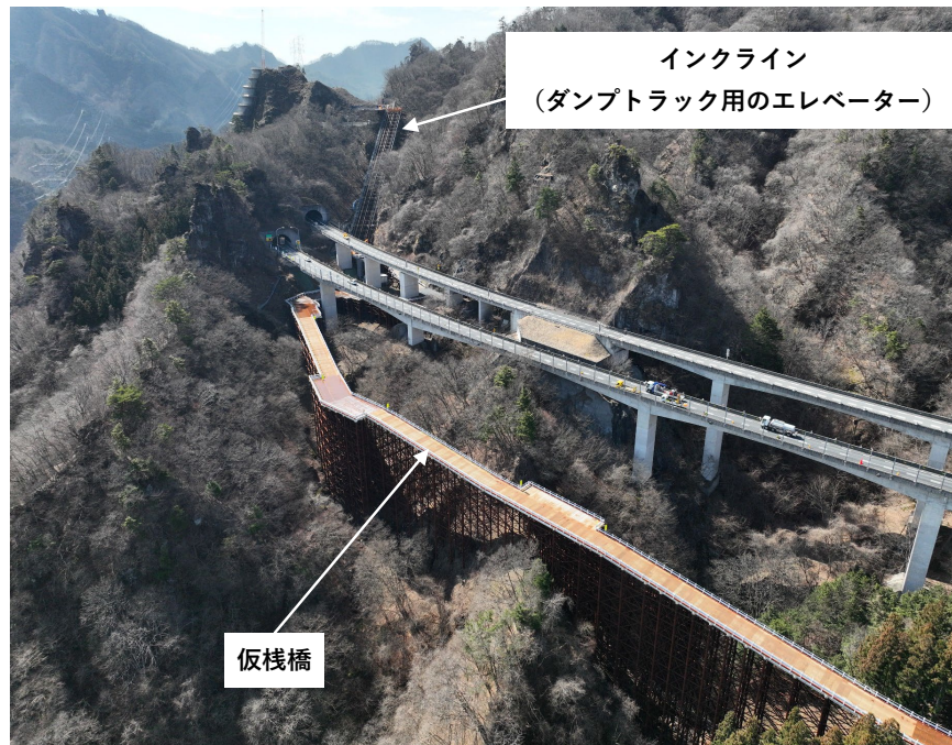
高崎側からの施工状況

平成29年から工事を開始し、掘削を行うための運搬路として仮栈橋及びインクライン（ダンプトラック用のエレベーター）、掘削時の安全対策としてロックシェッド（高速道路上の仮設の屋根）やロックボルト（岩塊からの落石を防止するために打設する鉄筋）などの設置・施工を行いました。令和5年5月より、本格的に掘削を開始し全ての工事が完了するのは令和10年を予定しています。