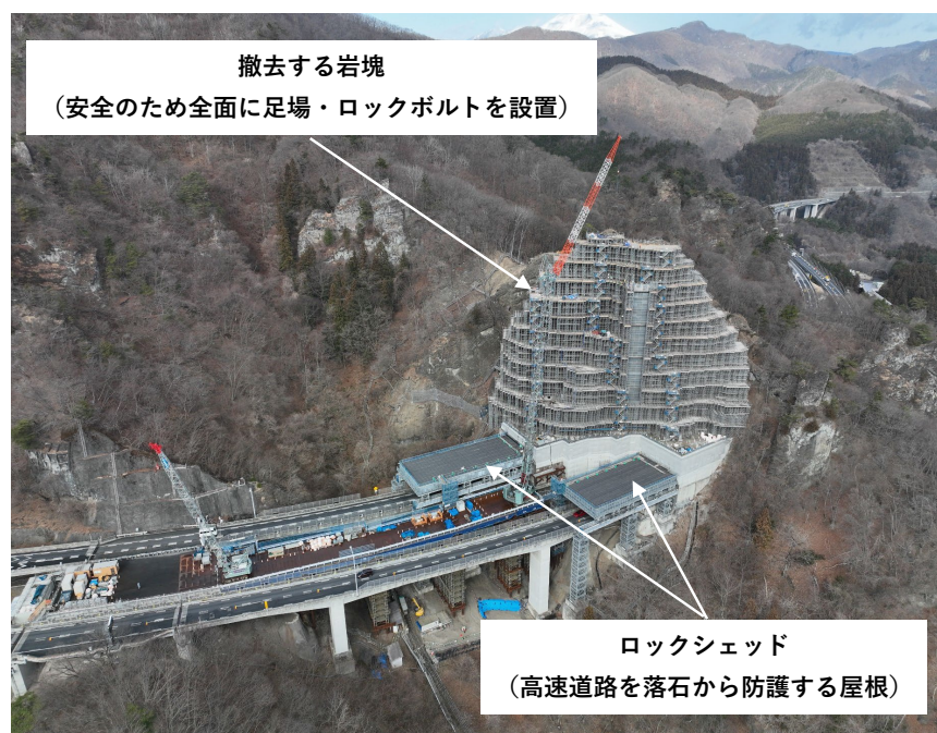
長野側からの施工状況