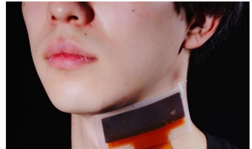
ウェアラブルエコーセンサ 研究開発用プロトタイプ使用例