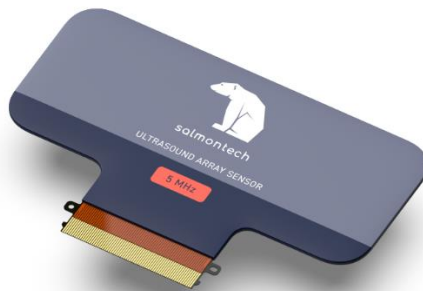
サーモンテック ウェアラブルエコーセンサ 製品モデルイメージ