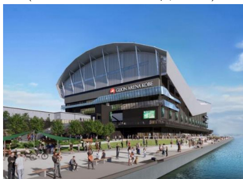
(GLION ARENA KOBE イメージ)