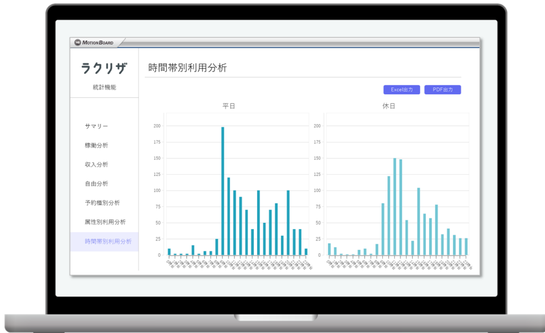
施設管理者向け機能：powered by MotionBoard