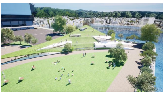
TOTTEI PARK イメージ