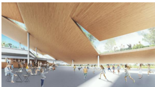
緑の丘の内部イメージ

緑の丘状の建物内には、全天候型の緑や木々が感じられる多目的スペースを用意し、新たなコミュニティプラットフォーム空間のご提供を予定しています。また、心地よい海風を感じながらお楽しみいただける BBQ レストランや、オリジナルクラフトビールを醸造するブリュワリーの開業など、唯一無二のダイニング体験を提供予定です。ぜひご期待ください。 (2025年4月に TOTTEI PARK のみ先行 OPEN、飲食施設は順次 OPEN 予定)