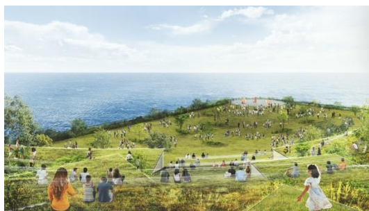
TOTTEI PARK 緑の丘イメージ