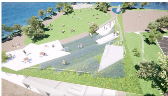
緑の丘から見た TOTTEI PARK イメージ

緑の丘状の建物内には、全天候型の緑や木々が感じられる多目的スペースを用意し、新たなコミュニティプラットフォーム空間のご提供を予定しています。また、心地よい海風を感じながらお楽しみいただける BBQ レストランや、オリジナルクラフトビールを醸造するブリュワリーの開業など、唯一無二のダイニング体験を提供予定です。ぜひご期待ください。 (2025年4月に TOTTEI PARK のみ先行 OPEN、飲食施設は順次 OPEN 予定)