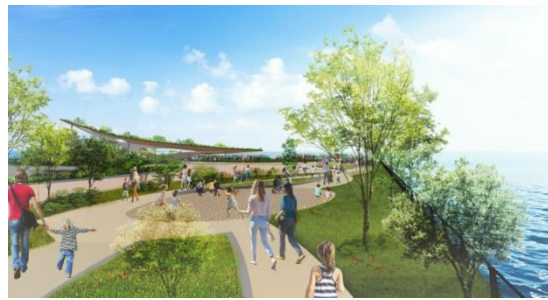
アリーナからパークへ続く遊歩道イメージ