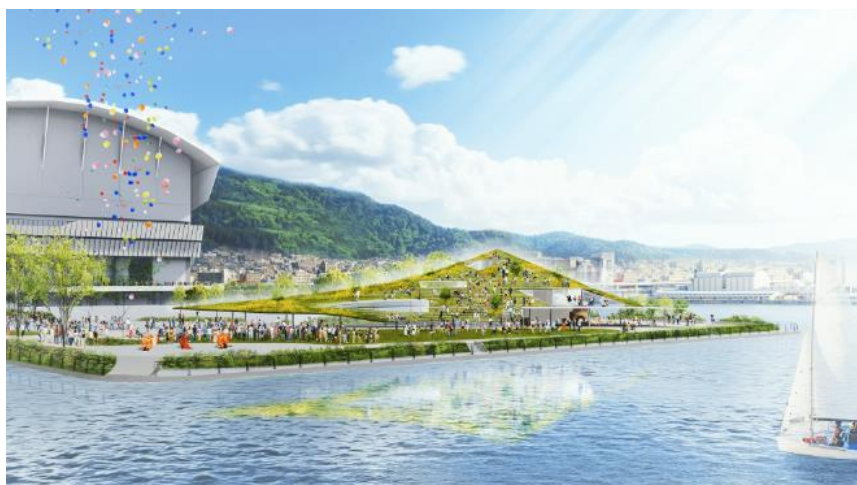
海から臨む TOTTEI PARK

2024年4月にアリーナが立地する新港第二突堤の愛称を「TOTTEI（トッテイ）※1」に決定し、最大1万人収容規模の次世代アリーナを中核施設に、レストラン・商業エリアの他、神戸の海と山並みを五感で楽しめる「TOTTEI PARK（トッテイパーク）」との一体運営により、神戸の最先端エンターテインメントエリアの創出を目指すことを発表しました。そして、このたびアリーナ開業と同時期の2025年4月開業に向け、「TOTTEI PARK」内建築物「緑の丘」の着工を開始いたしましたのでお知らせします。