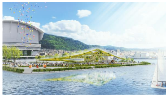
海からの TOTTEI PARK イメージ

「TOTTEI PARK」は、4つの設計コンセプト「Open（広場性）」「View（眺望性）」「Green（緑化）」「Symbolic（モニュメント性）」を基に、270度海に囲まれたロケーションで神戸の港と六甲山の山並みを五感で感じられるスポットのほか、365日「ここに来ると何かがある」神戸のエンターテインメント最先端エリアを目指します。