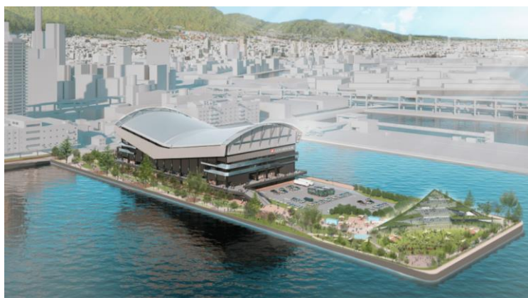
新港第二突堤エリア（愛称：TOTTEI）イメージ

One Bright KOBE は、神戸アリーナプロジェクトの運営企業として「この世界の心拍数を、上げていく。」を存在意義に、阪神淡路大震災より 30 年目の節目に誕生する GLION ARENA KOBE を基点に日常的なにぎわいづくりに取り組みます。アリーナは、開業後に B.LEAGUE 「神戸ストークス」のホームアリーナとなるほか、音楽コンサート、MICE などさまざまなイベントの開催を予定しています。