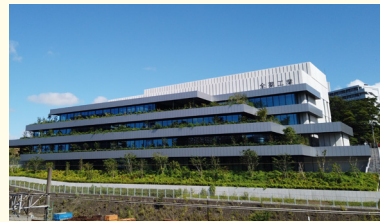
研究開発センター

私たちは、安全で安心して使える「薬」や「化粧品」などをつくっています。たとえば、かぜをひいたときに飲む薬や、健康を維持するための薬、また肌のうるおいを保つ化粧品などです。これらの製品は、主にドラッグストアや薬局などで販売しています。1950年の創業時から積み重ねてきた技術をいかし、皆さんに健康と美を提案し、笑顔になっていただくことを目指しています。