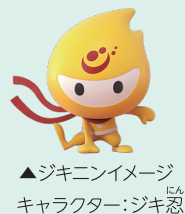
▲ジキニンイメージキャラクター:ジキ忍