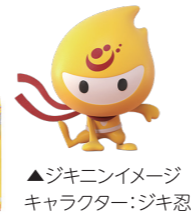
▲ジキニンイメージキャラクター:ジキ忍