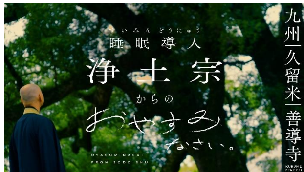
最新作の 大本山善導寺 編

今回の睡眠導入動画もまた、今を生きる「すべての人」を対象とするコンテンツとして皆様にお届けします。