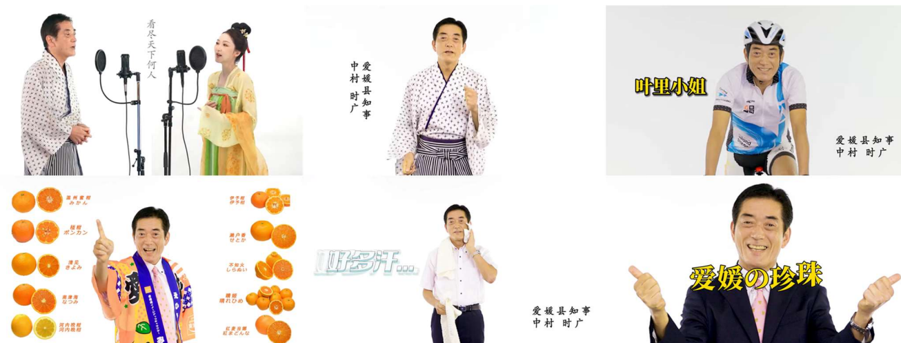
県産品の魅力を伝える中村時弘知事の出演する動画

11月11日は中国では「独身の日」と呼ばれ、EC 市場をはじめとした大規模なセールが繰り広げられる国民イベントとなっています。愛媛県では、この一大商戦期中に中村時弘知事が自ら県産品の魅力を中国語でアピール。中国の人気歌手「叶里（イエリー）」さんとデュエットするなど 6 種類の動画に出演し、中国での県産品の認知向上、販売促進を目指します。