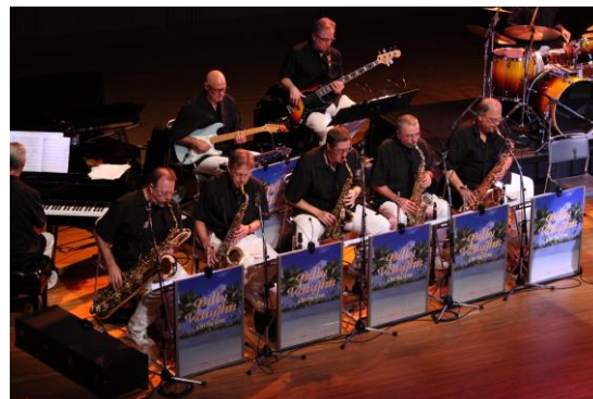
ビリー・ヴォーン・オーケストラ