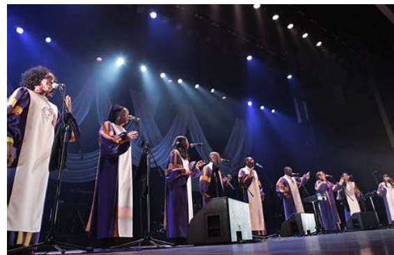
グローリー・ゴスペル・シンガーズ