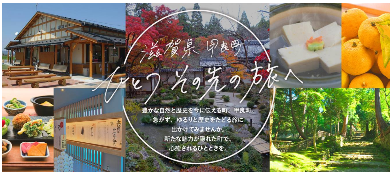
画像：ホームページトップ画像