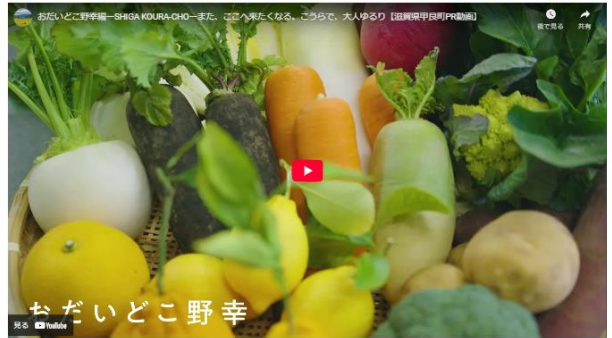
画像：甲良町のおすすめスポットの紹介

そのほか、実行委員会の各種プロジェクト紹介について更新していくコーナーを設けています。