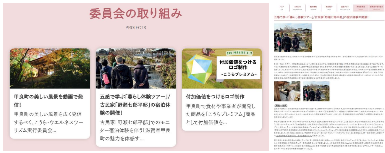
画像：実行委員会の取り組み紹介

そのほか、実行委員会の各種プロジェクト紹介について更新していくコーナーを設けています。