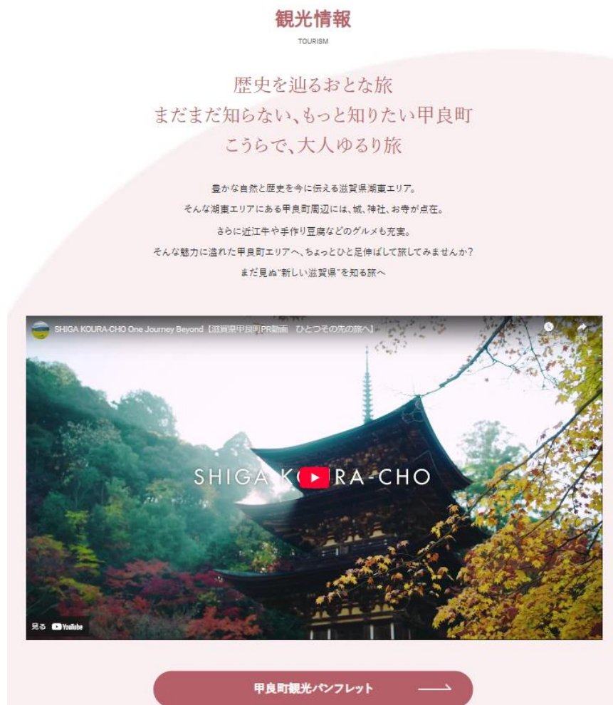
画像：PR 動画と観光パンフレット

ホームページでは甲良町の観光情報として、これまで実行委員会で制作した PR 動画や観光パンフレットを掲載しています。