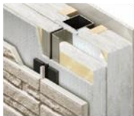
エクストラV断熱仕様

自由設計でご成約いただいた方が対象。「GX スマートパッケージ」は、大和ハウスの住宅商品が持つ高い省エネ性能をさらに高め、ZEHを超えた快適性を提供します。「子育てグリーン住宅支援事業」のGX志向型住宅※に必要な仕様を記念価格でパッケージ化。