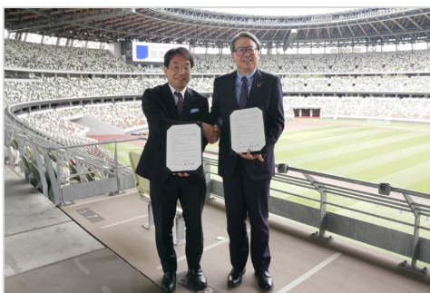
左からTMI境田パートナー 弁護士、JSC芦立理事長

TMI総合法律事務所は、幅広い業務領域と専門性を持ち、スポーツの分野においても国内外のスポーツイベント・リーグの運営、競技団体やアスリートのサポート、スポーツ法政策の提言等を含めた豊富な経験を持ち、エンターテインメントの分野においても数多くの対応実績を有しております。これらのノウハウ・経験を活かして、eスポーツを含むハイパフォーマンススポーツにおける競技環境の整備、競技力の向上及び産業の振興と発展に向けて、協力できるよう取り組んで参ります。