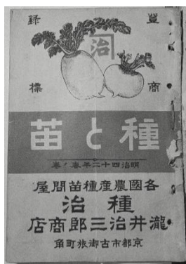
1909年の通販カタログ 「種と苗 明治42年春の播き」 表紙