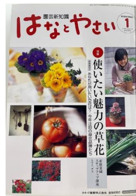
『園芸新知識 はなとやさい』 2006年1月号』表紙

家庭菜園とガーデニングの両方を楽しむ方の増加とともに、前身の『園芸新知識』の『野菜号』と『花の号』を合体し、2006年（平成18年）1月号より一般の園芸愛好家に向けた『園芸新知識 はなとやさい』が発刊されました。現在、友の会会員様にのみ配布されている月刊誌『はなとやさい』は190年に及ぶタキイ種苗創業からの歴史と機関誌発刊から70年以上にわたる歴史、そこから培われた野菜作りと花作りのノウハウが凝縮されています。会員様とタキイ種苗が繋がるものとして、今後も大切にしていきたいと考えています。