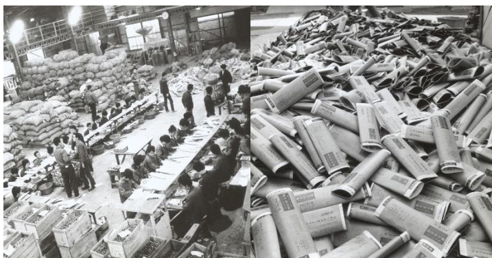
1950年代 山積みになったカタログの発送の様子