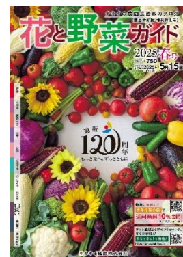
120周年記念カタログ 「花と野菜ガイド 2025年春号」 表紙

明治38年（1905年）、今から120年前にタキイ種苗（当時：種治本店）は、日本で初めてカタログを使用した種苗の通信販売を開始しました。その後、昭和26年（1951年）1月には、農場見学や会報誌『園芸新知識』などの特典が付いた、誰でも入会できる「タキイ友の会」を発足しました。現在では、通販事業はウェブ上の「タキイネット通販」と年2回発刊されるカタログ『花と野菜ガイド』を中心に、さまざまな品種の情報を発信しています。その他にも菜園愛好家の増加に伴い刷新された園芸情報誌『はなとやさい』（月刊誌）や講習会「野菜勉強会」など、多彩な特典が人気を集めており、「タキイ友の会」会員は約8万人に達しています。「タキイ友の会」には40年以上在籍されている方もおり、自宅の庭での手入れや貸し農園で精力的に野菜を育てている方など、活動内容は多岐にわたります。会員の年代は10代～90代と幅広く、多くの方々に親しまれています。