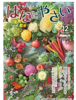
『園芸新知識 はなとやさい』 2024年12月号』表紙