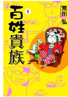
協力:東京農業大学「食と農」の博物館

マンガ家になる前に北海道で実家の酪農・畑作業に従事していた荒川 弘先生の農家エッセイコミック「百姓貴族」(株式会社新書館発行・隔月刊「ウイングス」連載中)と東京農業大学、農林水産省とのコラボ企画です。パワフルエピソード満載のマンガと、東京農業大学をはじめとした専門家の解説によるテーマごとのコーナーを設置し、持続可能な農業や環境、いのち…について紹介します。